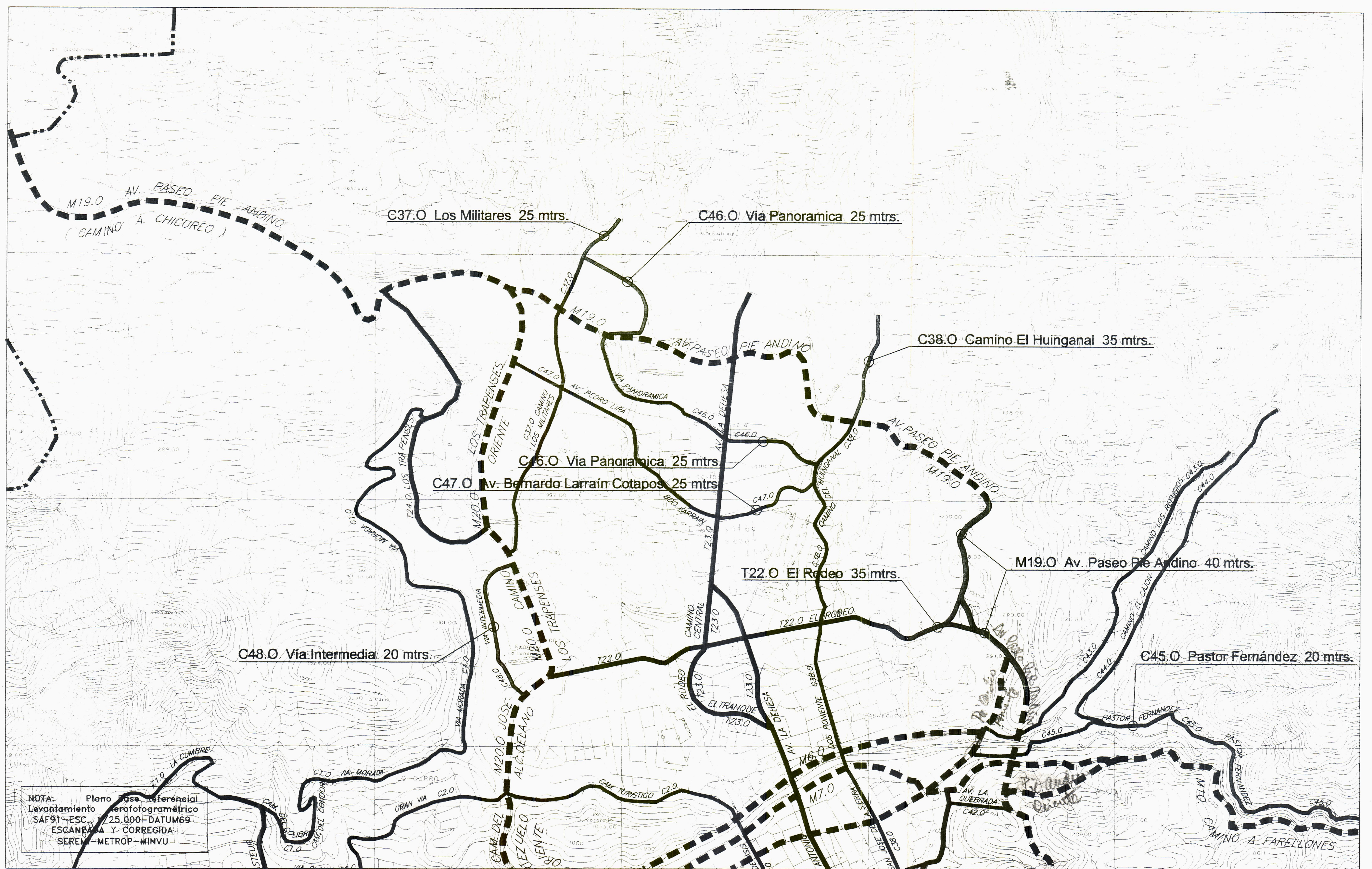
SITUACION QUE SE APRUEBA